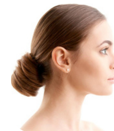
Doppelkinn, Hals & Décolleté