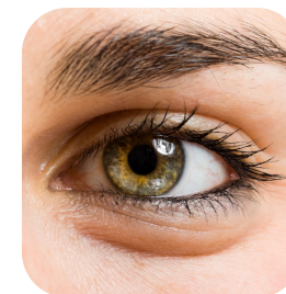
Augenlidstraffung ohne Operation