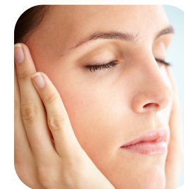
Facelift ohne Narben